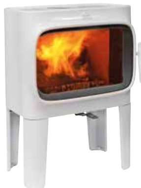
JØTUL F 305 R LL WHE UPUST 1 690,-* TERAZ 6 780,-* Było 8 470,-*