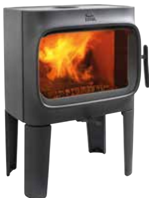
JØTUL F 305 R LL BP UPUST 1 140,-* TERAZ 4 560,-* Było 5 700,-*

Norwescy projektanci Anderssen & Vøll zaprojektowali piec Jøtul F 305 w którym ponadczasowe wzornictwo łączy się ze 160 letnim doświadczeniem. Duże palenisko w układzie poziomym ułatwia załadunek polan do 40 cm długości. Piece na drewno Jøtul F 305 Series nadają się do montażu w domach o niskim zapotrzebowaniu na energię i domach pasywnych – posiadają możliwość podłączenia zewnętrznego powietrza do spalania.